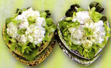
5 กล่องหัวใจ...ใส่รัก ราคา 160.- บาท