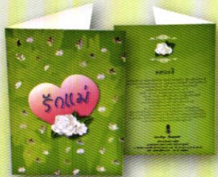
4 บัตรอวยพร...ส่งรักให้แม่ ราคา 50.- บาท