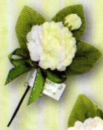
1 ช่อมะลิ "รักแม่" ราคา 10.- บาท