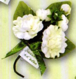
2 ช่อมะลิ "รวมใจรักแม่" ราคา 20.- บาท