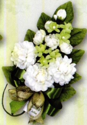
3 ช่อมะลิ "ร้อยรวมรัก" ราคา 50.- บาท