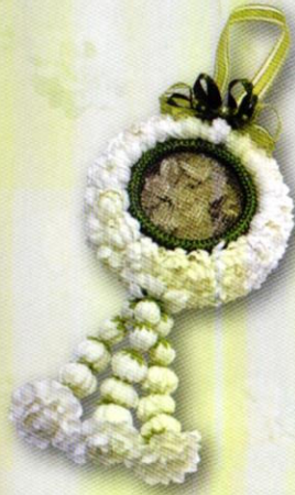
7 โมบายบุหงา...ฝากรักแม่ ราคา 300.- บาท