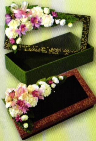
9 กล่องมะลิ...สิริรัก ราคา 320.- บาท