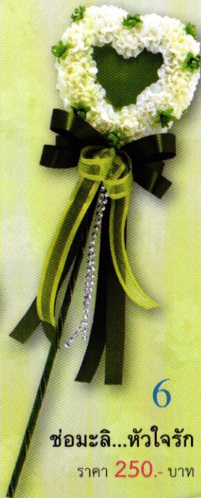
6 ช่อมะลิ...หัวใจรัก ราคา 250.- บาท