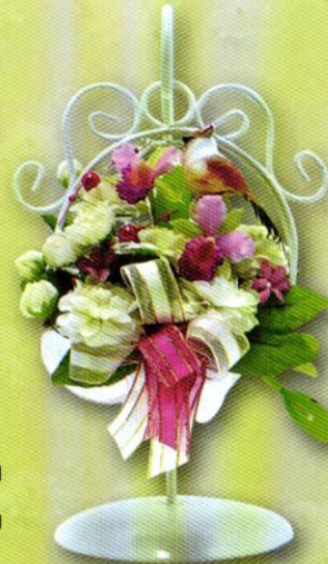
10 กระเช้าน้อย...ร้อยรัก ราคา 320.- บาท