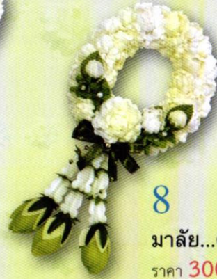
8 มาลัย...คล้องใจแม่ ราคา 300.- บาท