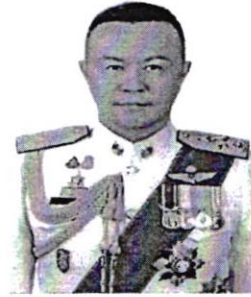
๒. พลตำรวจเอก วัชรพร เพาะสุนทร ที่ปรึกษาพิเศษสำนักงานตำรวจแห่งชาติ