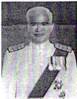
๓. นายชัยนันท์ งามขจรกุลกิจ อดีตอัยการพิเศษฝ่ายทรัพย์สินทางปัญญา และการค้าระหว่างประเทศ ๒