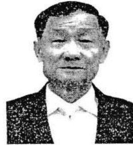
๖. พลเรือเอก ประสาน สุขเกษตร อดีตรองผู้บัญชาการทหารสูงสุด