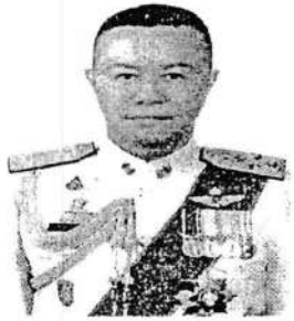
๕. พลตำรวจเอก ธีรยุทธ เพราะสุนทร อดีตที่ปรึกษาพิเศษ สำนักงานตำรวจแห่งชาติ